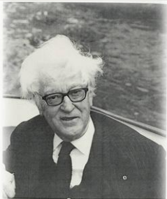
Николай Набоков. Визитка, 1971 г.